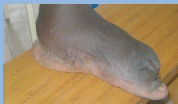
FIGURE 7 : Même pied que Figure 2, début juin 2009.