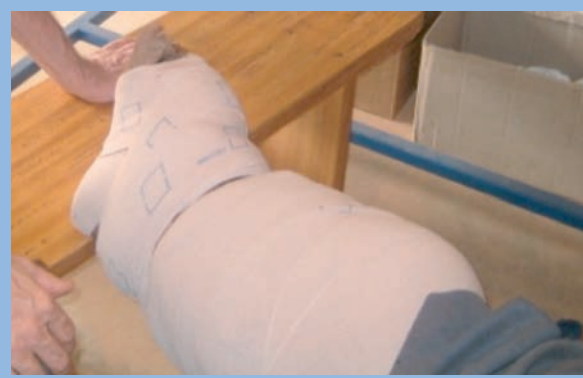
FIGURE 6 : Pose de la cinquième bande !