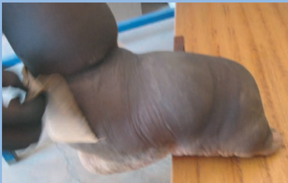
FIGURE 2 : Éléphantiasis pied gauche, pied droit normal.