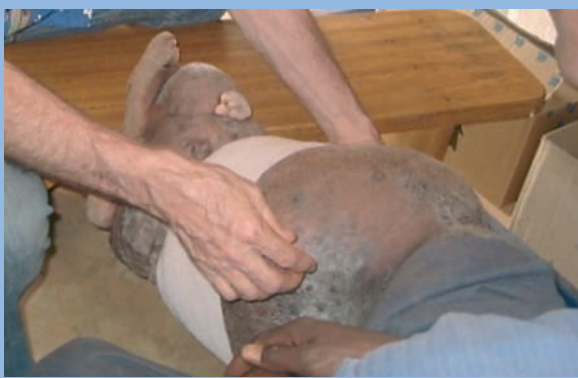
FIGURE 5 : Pose de la deuxième bande !