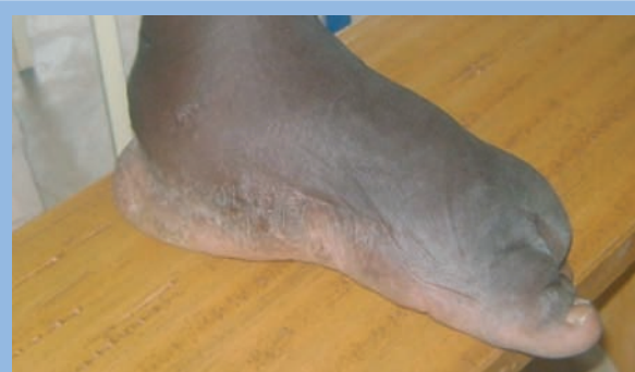
FIGURE 7 : Même pied que Figure 2, début juin 2009.