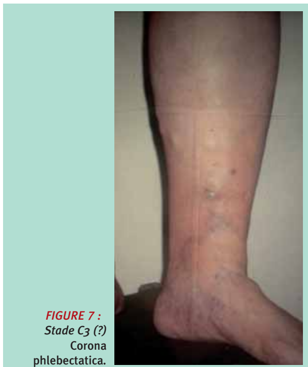
FIGURE 7 : Stade C 3 (?) Corona phlebectatica.

C'est une classification descriptive (clinique-étiologique-anatomique et physiopathologique).