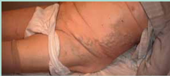
FIGURE 4 : Exemple de MPT avec circulation collatérale après occlusion thrombotique de la veine cave inférieure.