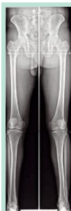
FIGURE 2 : Téléradiographie des membres inférieurs avec axe.

Nous essayerons de classer les sujets en groupes distincts en fonction des résultats.