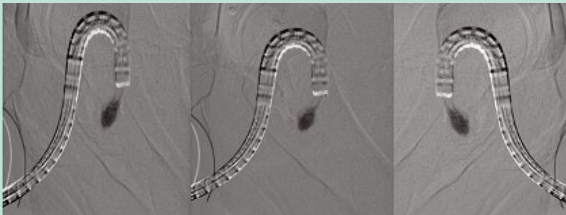
FIGURE 2 : Angio TC con mdc + aetoxisclerol du plexus hémorroïdaire. Merci au D r M. Ronconi.

En outre, compte tenu de sa simplicité et de son caractère peu invasif, une telle procédure peut facilement être répétée en cas de récurrence.