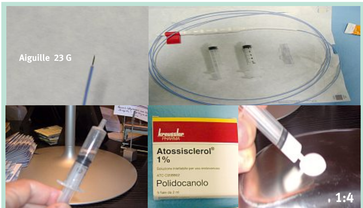
FIGURE 1 : Matériel pour l'endoscléromousse avec technique de « HemoRCol ».

À chaque visite, des données ont été recueillies au moyen d'un questionnaire de qualité de vie et d'une échelle normalisée de douleurs sur le nombre d'épisodes de saignement, sur l'aggravation des hémorroïdes, sur la douleur et sur l'inconfort.