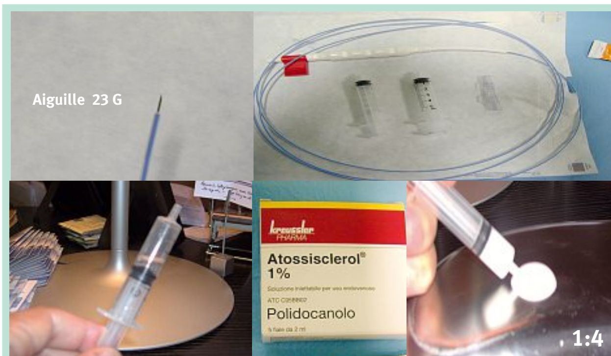
FIGURE 1 : Matériel pour l'endoscléromousse avec technique de « HemoRCol ».

À chaque visite, des données ont été recueillies au moyen d'un questionnaire de qualité de vie et d'une échelle normalisée de douleurs sur le nombre d'épisodes de saignement, sur l'aggravation des hémorroïdes, sur la douleur et sur l'inconfort.