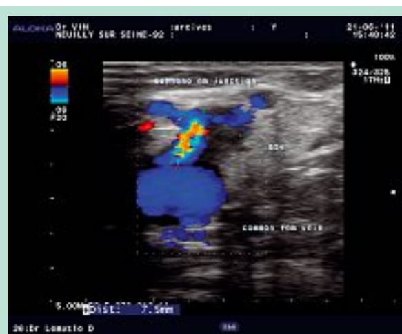
FIGURE 3 : Drainage des collatérales de la jonction après procédure endoveineuse.

Dans une veine remplie de solution saline, la lésion de la paroi veineuse est localisée au point d'impact du tir laser. Dans une veine remplie de sang, les lésions de la paroi veineuse sont plus importantes autour du point d'impact. Le sang joue un rôle dans l'absorption de l'énergie mais aussi dans sa diffusion grâce à l'ébullition du sang.