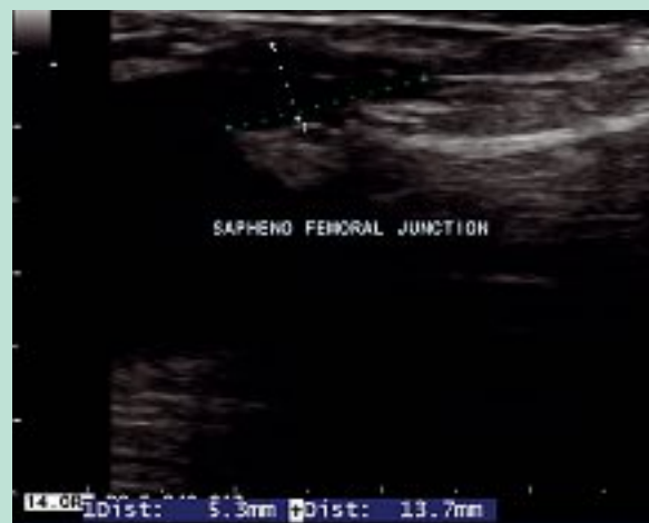
FIGURE 2 : Segment intervalvulaire résiduel après procédure endoveineuse.