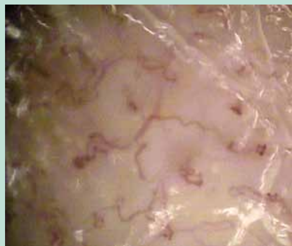
FIGURE 2 : Vidéo-capillaroscopie mettant en évidence des sinuosités, des micro-anévrismes, des hémorragies, des microthromboses.