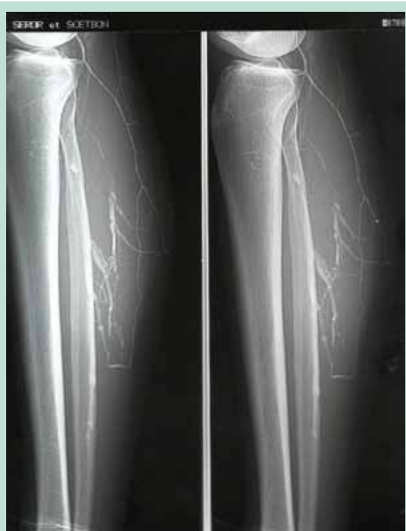
FIGURE 7 : Microphlébographie au fil de l'eau visualisant l'opacification des veines gastrocnémiennes et la communicante fibulaire.