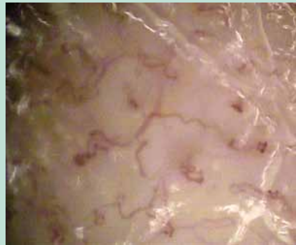
FIGURE 2 : Vidéo-capillaroscopie mettant en évidence des sinuosités, des micro-anévrismes, des hémorragies, des microthromboses.