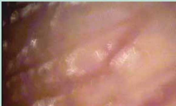
FIGURE 5 : Télangiectasie rouge de face latérale de cuisse.