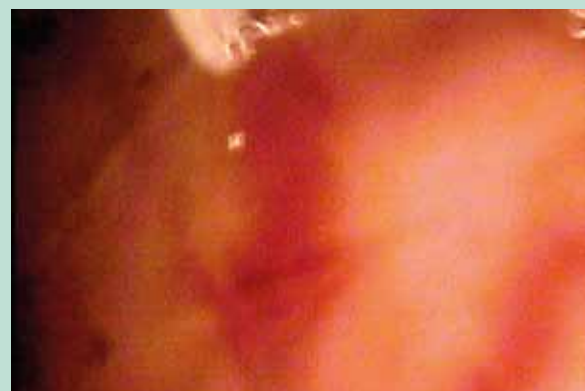
FIGURE 4 : Télangiectasie rouge de cuisse, œdème périveinulaire.