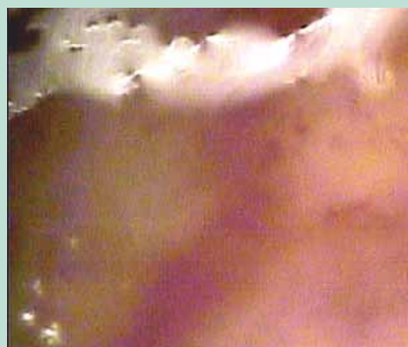
FIGURE 3 : Télangiectasie rouge de jambe, œdème péroveinulaire caractérisé par le flou, faible sinuosité.

Elles sont de type rouge et moins sensible à la sclérothérapie. Leurs aspects évoquant comme il l'a été décrit précédemment une atteinte du tissu péroveinulaire. Des auteurs italiens ont récemment proposé d'injecter de l'acide hyaluronique en péroveinulaire afin de les traiter.