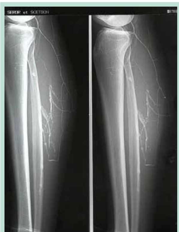
FIGURE 7 : Microphlébographie au fil de l'eau visualisant l'opacification des veines gastrocnémiennes et la communicante fibulaire.