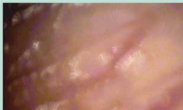
FIGURE 5 : Télangiectasie rouge de face latérale de cuisse.