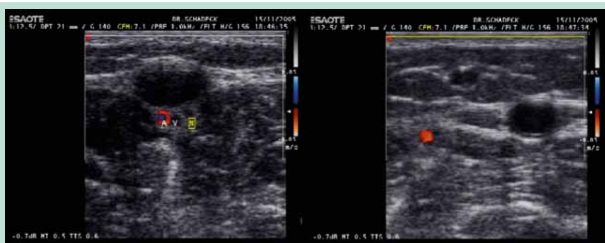
FIGURE 3 : Artère de la PVS accompagnée de sa veine et de son nerf satellite (à gauche). La même artère 2 cm plus bas, éloignée de la PVS (à droite).