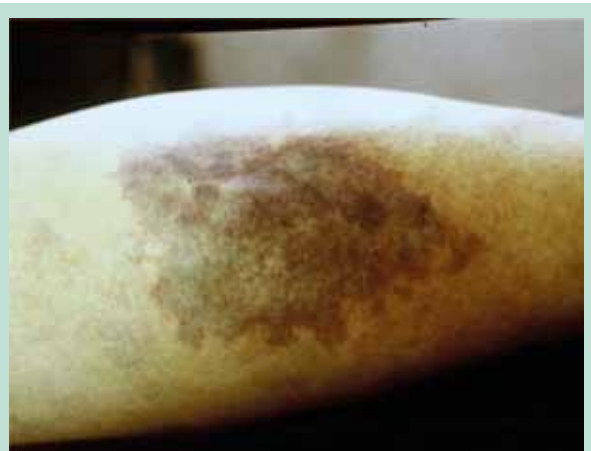
FIGURE 4 : Nécrose tissulaire après injection de l'artère de la petite veine saphène (1995).