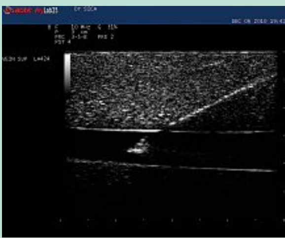
PHOTO 5 : Visualisation de l'aiguille en position endoluminale dans la saphène artificielle.