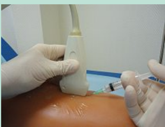
PHOTO 7 : Injection échoguidée de la mousse dans l'axe saphénien du simulateur.