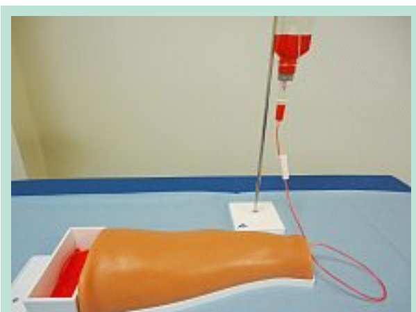
PHOTO 2 : Simulateur après remplissage du liquide dans la tubulure et vidage dans le boîtier tiroir.