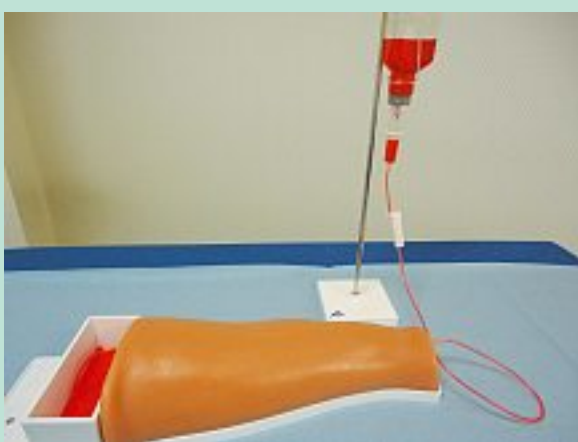
PHOTO 2 : Simulateur après remplissage du liquide dans la tubulure et vidage dans le boîtier tiroir.