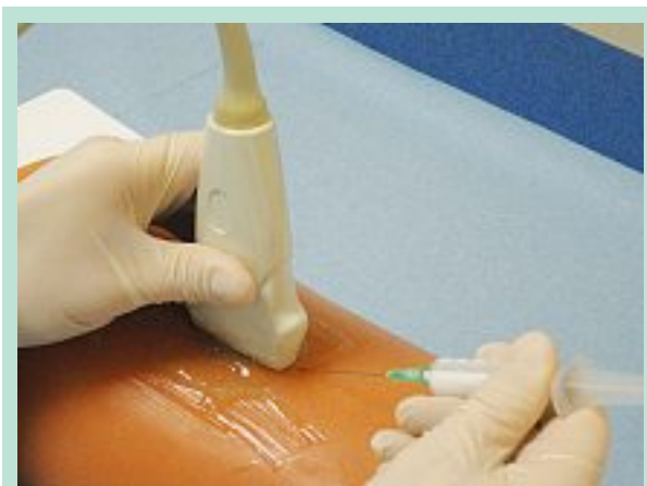
PHOTO 4 : Injection échoguidée avec inclinaison de la seringue à 45°.