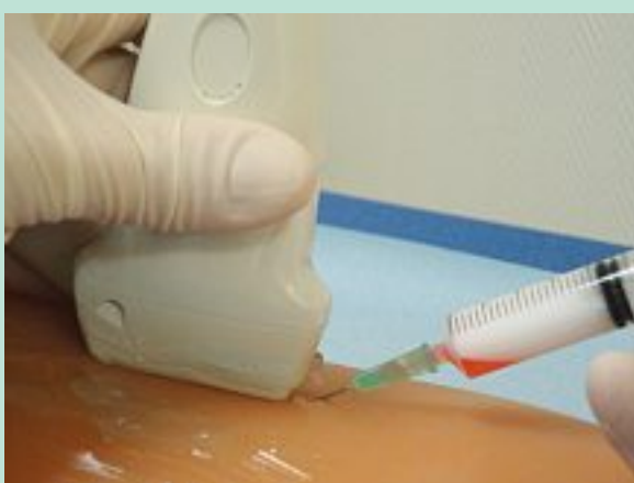
PHOTO 6 : Recherche d'un reflux dans la seringue avant injection dans la saphène artificielle.