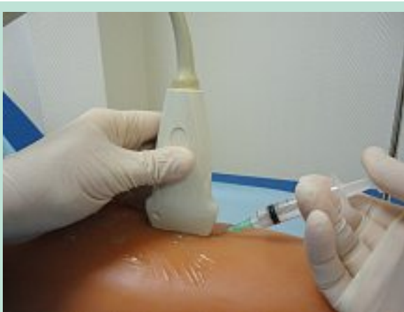
PHOTO 7 : Injection échoguidée de la mousse dans l'axe saphénien du simulateur.