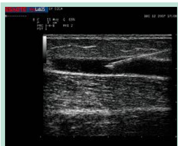
PHOTO 9 : Injection échoguidée en coupe longitudinale sur une veine réelle.