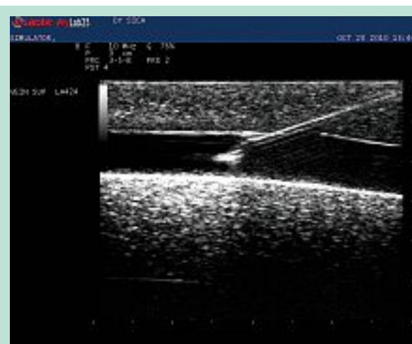
PHOTO 10 : Injection échoguidée en coupe longitudinale sur une veine artificielle du simulateur.