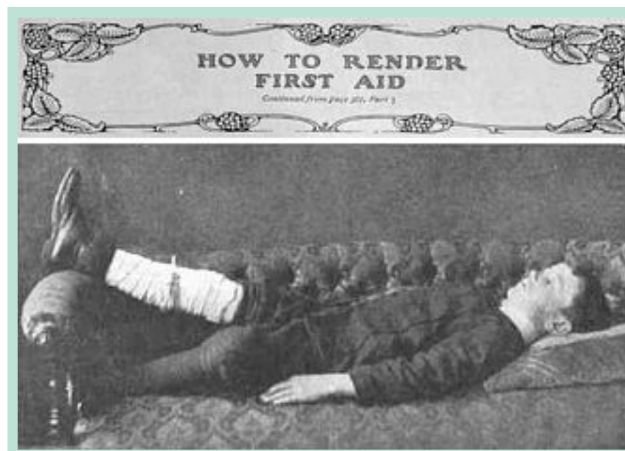
FIGURE 2 : Extrait d'un livre de premier secours datant du début du siècle indiquant comment prendre en charge une hémorragie variqueuse : surélévation du membre inférieur et bandage compressif.