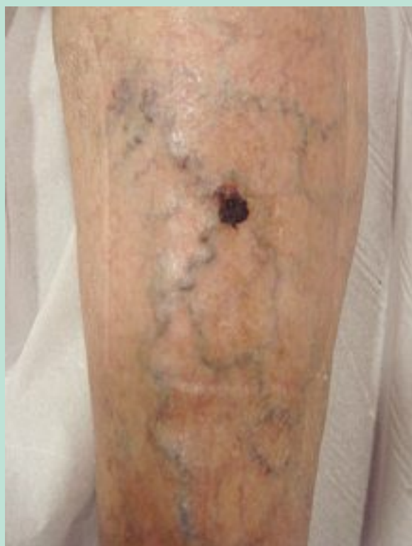
FIGURE 4 : Même patiente que celle de la photo 3, avec présence d'une croûte à une semaine.