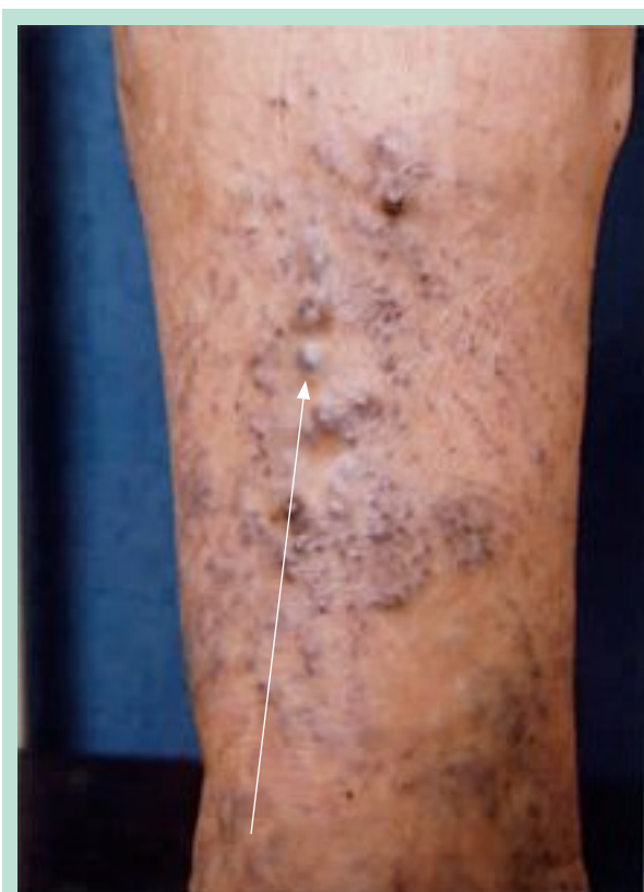
FIGURE 1 : Exemple d'ectasie variqueuse : la rupture d'une varice est la complication d'une forme particulière de maladie veineuse. En effet, elle touche souvent de petits anévrysmes veineux (ectasies veineuses) intra-dermiques qui vont se rompre secondairement à des traumatismes bénins.

Douze patients ont été recrutés entre septembre 2007 et septembre 2009. Tous sont venus en urgence pour prise en charge d'hémorragie d'une ectasie de varice réticulaire des membres inférieurs. La cause de la rupture était dans tous les cas un petit traumatisme.