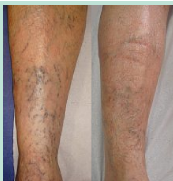
FIGURE 8 : Exemple de traitement d'ectasies variqueuses au laser Nd YAG à 1064 nm : 3 séances espacées de 1 mois chacune.