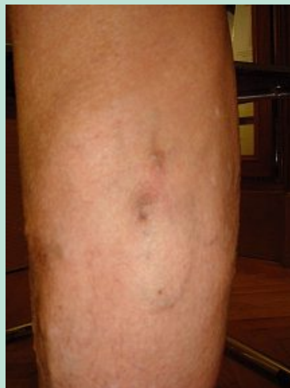
FIGURE 5 : Patient avec ectasie sclérosée; présence d'une hyperpigmentation résiduelle.

Chez 4 patients, il existe un petit piqueté rosé hémorragique autour de la croûte qui justifie une nouvelle séance de laser comportant un à trois tirs avec les mêmes paramètres que ceux utilisés la première fois.