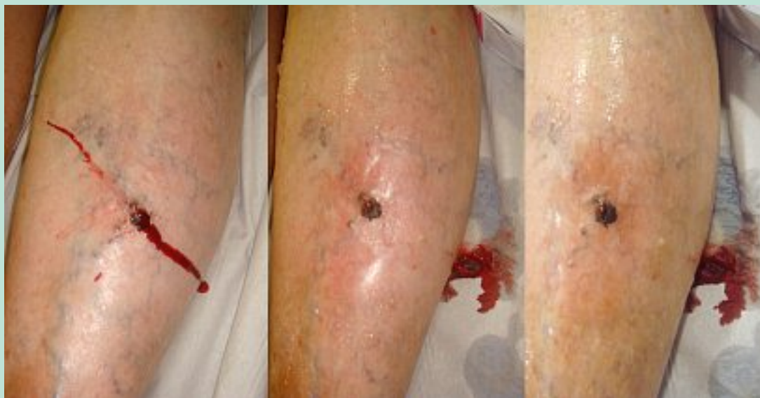
FIGURE 3 : Patiente venue en urgence pour hémorragie d'ectasie variqueuse ; nettoyage de la peau à l'eau oxygénée puis première séquence de deux tirs laser. Devant la persistance de l'hémorragie est effectuée une deuxième série de tirs laser.

Tous les patients étaient sous AVK. Un INR a été demandé le jour même.