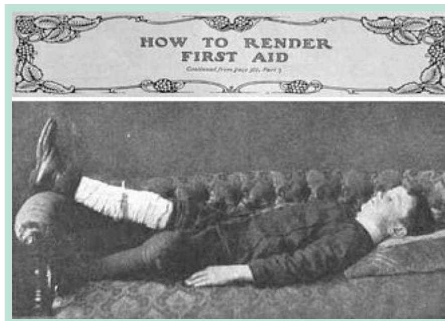
FIGURE 2 : Extrait d'un livre de premier secours datant du début du siècle indiquant comment prendre en charge une hémorragie variqueuse : surélévation du membre inférieur et bandage compressif.