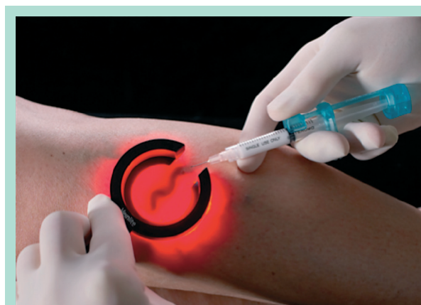
FIGURE 2 : La transillumination.

L'examen clinique des veines réticulaires [6] est pauvre. L'inspection et la palpation en sont les éléments clés.