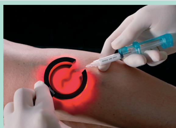
FIGURE 2 : La transillumination.

L'examen clinique des veines réticulaires [6] est pauvre. L'inspection et la palpation en sont les éléments clés.