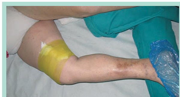
FIGURE 1 : Compression d'une veine variqueuse superficielle.

Nous appliquons une compression de 10-15 mmHg ou 20-35 mmHg et contrôlons par l'EDC afin de ne pas provoquer une oblitération complète de ce segment veineux.