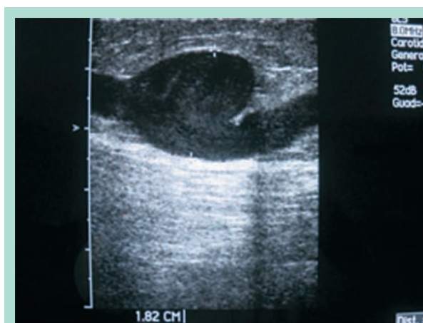
FIGURE 2 : Aspect échographique d'un anévrisme de la grande veine saphène.

L'épuisement de la capacité sclérosante de la mousse est essentiellement due à la détérioration de la mousse et donc à son effet « piston » [12, 13, 14, 15]. Il est aussi prévisible que lorsque la mousse dans sa progression, par exemple le long de l'axe de la saphène, rencontre une veine de calibre majeur, comme la veine fémorale commune, son effet sclérosant chute brusquement, avec un effet de lavage.