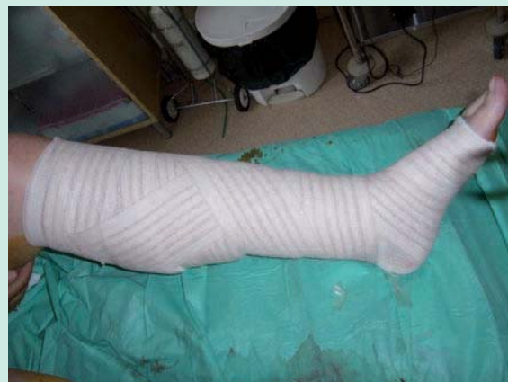
FIGURE 4 : Contention par pansement absorbant+somos®+extensoplast®.

La réduction des circonférences des chevilles s'est établie de 0.8 cm à 2.6 cm ce qui correspond à une réduction