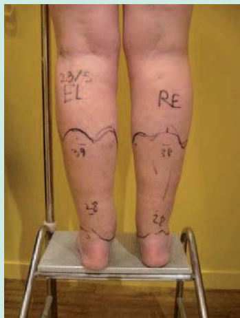
FIGURE 1 : Mesure de la circonscription de la cheville à deux niveaux 8 à 16 cm au sol.

Ce geste doit être réalisé dans de bonnes conditions d'asepsie, avec badigeonnage à la Bétadine dermique® de tout le membre et pose de champs stériles, l'opérateur portant masque, calot et gants stériles.