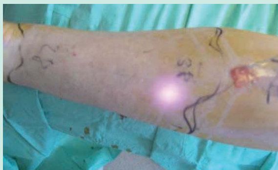
FIGURE 3 : En per procédure, noter l'apparition d'une émulsion grasseuse au niveau d'introduction de la pièce à main.

3000 à 3500 joules seront délivrés de chaque côté jusqu'à obtention du résultat qui est visible en per procédure (figure 3).