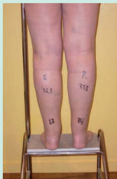
FIGURE 5 : Aspect post opératoire à J 8 fin de journée.