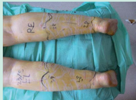
FIGURE 2 : Anesthésie tumescente.

Cette tumescence permet de réaliser une anesthésie très efficace et de doubler l'épaisseur de la zone de travail (4,5). L'utilisation d'une aiguille de Klein permet de rendre ce temps plus rapide et contribue à provoquer une tunnelisation de la zone.