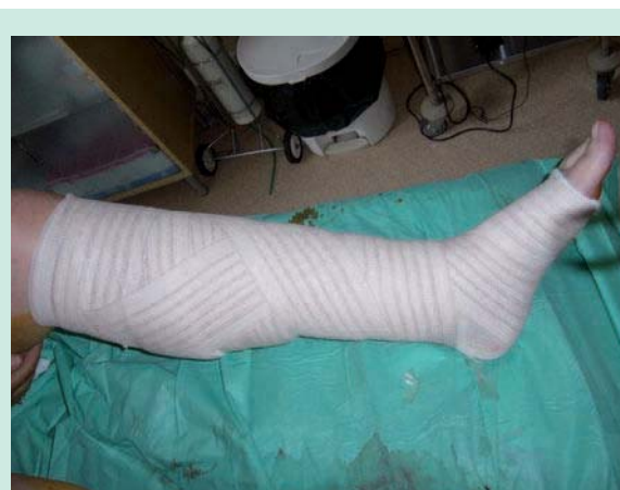
FIGURE 4 : Contention par pansement absorbant+somos®+extensoplast®.

La réduction des circonférences des chevilles s'est établie de 0.8 cm à 2.6 cm ce qui correspond à une réduction