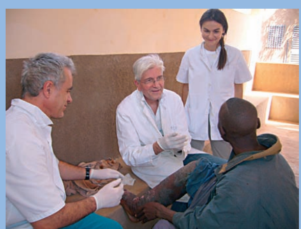
FIGURE 5 : Les consultations s'effectuent toujours en concertation et dans la bonne humeur !