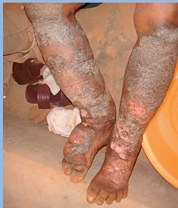
FIGURE 2 : Éléphantiasis bilatéral chez un jeune traité depuis 9 mois par compression ; en haut, aspect initial en janvier 2009 ; à droite, aspect en décembre 2009 : l'amélioration est spectaculaire !

La filariose lymphatique touche 120 millions de personnes dans le monde dont un tiers vit en Afrique [1]. Elle est due à des vers parasites filiformes transmis à l'homme par les piqûres de moustiques (cf. encadré).