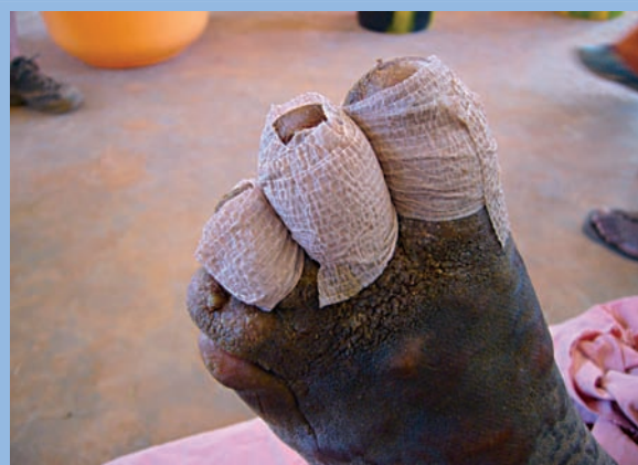
FIGURE 7 : Mise en place d'une compression élective des zones les plus œdemaciées.