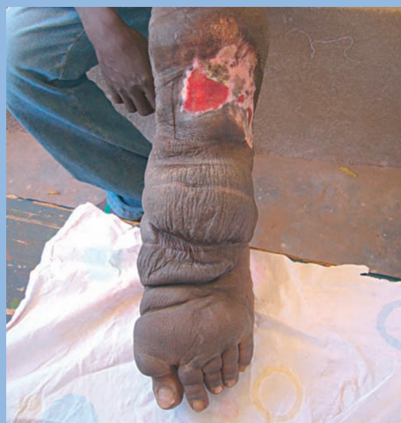
FIGURE 8 : Patient consultant pour un volumineux éléphantiasis ulcéré (en haut) ; après 48 heures de compression, l'amélioration de l'œdème est déjà évidente (en bas).