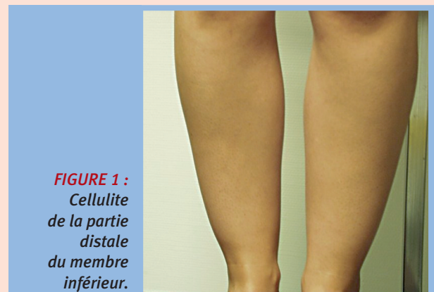
FIGURE 1 : Cellulite de la partie distale du membre inférieur.

La patiente type est représentée par une femme plutôt mince, mais avec des jambes un peu rondes.