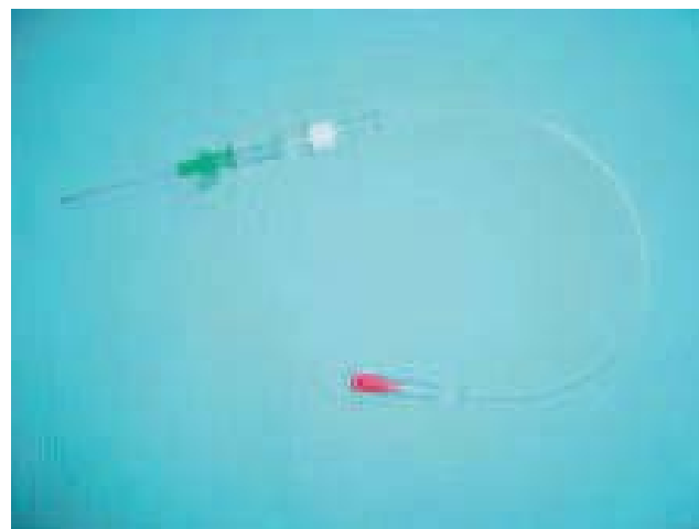
Photo 2. – Cathéter court relié à un prolongateur pour le traitement des saphènes d'un calibre supérieur à 6 mm.

Le cathéter par rapport à la méthode de ponction-injection directe procure :