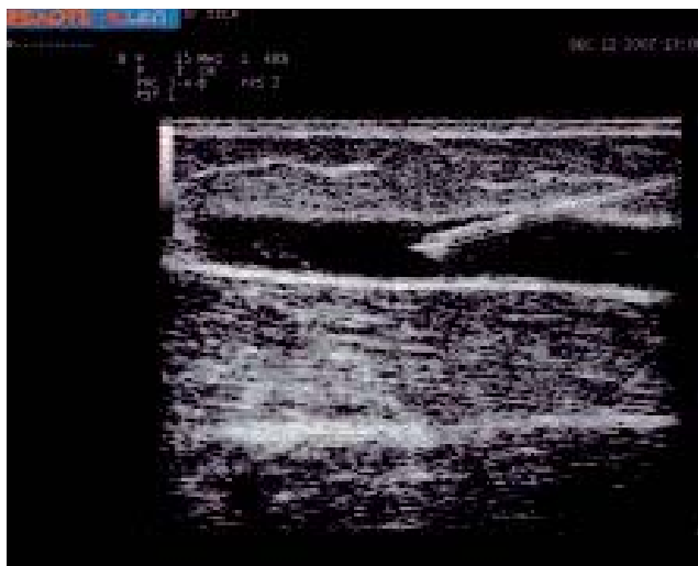
Photo 1. – Visualisation de l'aiguille en position endoluminale pendant une sclérothérapie échoguidée par ponction directe.

– pour les saphènes de gros calibre (au-delà de 8 mm) nous utilisons le tétradécyl sulfate de sodium Trombovar® dilué à 1 %.