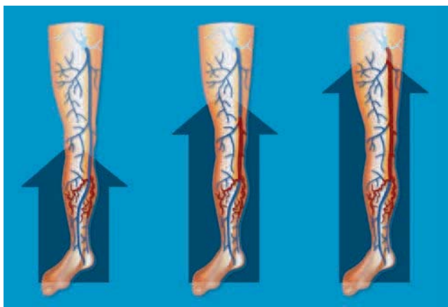
Fig. 4. – Théorie de l'évolution hémodynamique antérograde (EHA) de l'insuffisance veineuse superficielle (IVS)

Le concept de l'EHA permet d'esquisser des réponses aux questions évoquées précédemment :