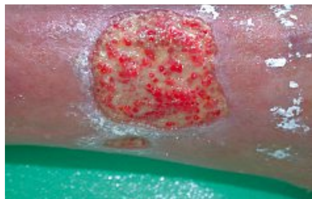
Photo 1. – Début de traitement, J0 (Patient A)

Par ailleurs, les ulcères présentent à l'inclusion, un caractère douloureux modéré à important dans 37 % des cas.