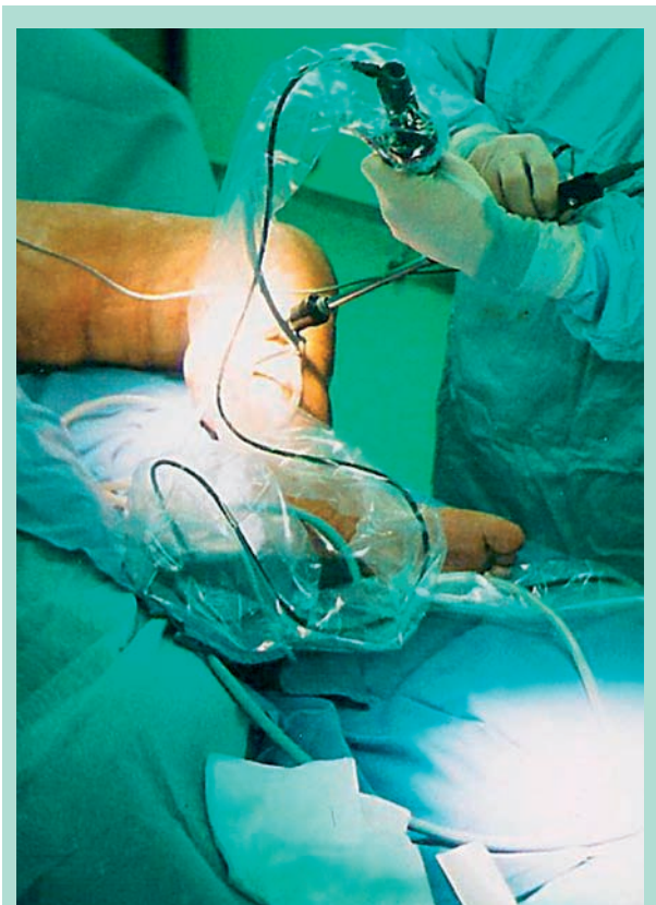
FIGURE 7 : Vue opératoire.