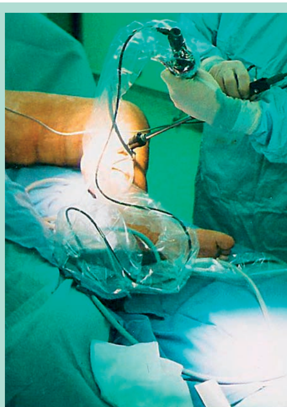
FIGURE 7 : Vue opératoire.