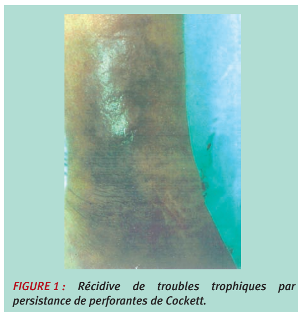
FIGURE 1 : Récidive de troubles trophiques par persistance de perforantes de Cockett.

Pour Darke, Sarin et Gohel, l'éveinage [7, 8] seul ou associé à la compression [9] permet d'obtenir la cicatrisation de l'ulcère dans 90 à 93 % des cas à 3 ans.