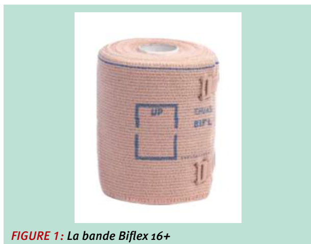
FIGURE 1: La bande Biflex 16+

Le lymphœdème concerne le membre supérieur mais peut également affecter le sein et le thorax. Au niveau du membre supérieur, il peut engendrer des symptômes associés telles que la douleur, la lourdeur, l'oppression et la réduction de l'amplitude de l'épaule ayant un effet négatif sur la vie quotidienne des patientes ainsi que sur leur activité globale [1].