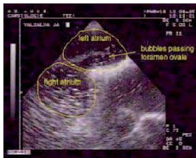
Fig. 3. – Vue échographique transœsophagienne du passage de microbulles à travers le foramen ovale perméable. P. Germoupré

En cas de lésion du septum atrial, les mesures obtenues par ces 2 techniques, comparées à la mesure per-opératoire en cas d'intervention, confirment la fiabilité de l'échographie [23]. On remarque que toutes deux ont tendance à sous-évaluer le défaut.