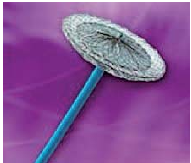
Fig. 4. – Amplatz PFO Occluder (medtel.com)

Deux modèles sont plus couramment utilisés : Amplatz PFO Occluder (Schéma 4) (AGA Medical Corp., Golden Valley, MN) et CardioSEAL (NMT Medical Inc., Boston, MA) [1].