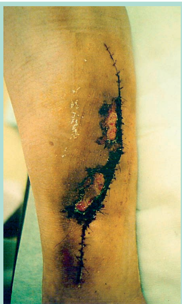
FIGURE 4 : Nécrose cutanée observée après une intervention de Linton.

Par ailleurs des perforantes incontinentes redeviennent continentes après suppression du reflux veineux superficiel dans 27 % des cas dans l'étude ESCHAR [12] et de 74 % des cas pour Al-Mulhim [13].