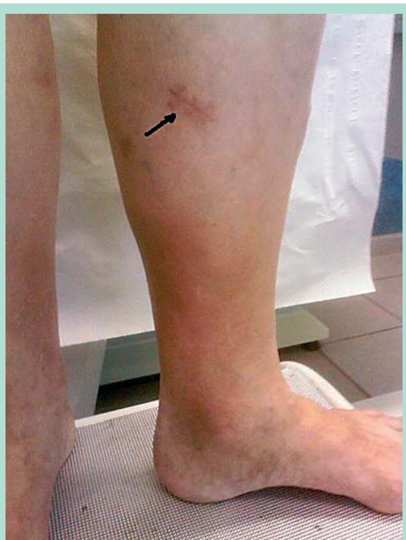
FIGURE 8 : Incision pour procédure endoscopique.