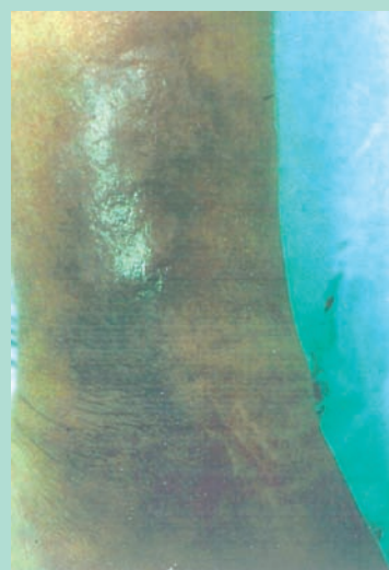
FIGURE 1 : Récidive de troubles trophiques par persistance de perforantes de Cockett.

Pour Darke, Sarin et Gohel, l'éveinage [7, 8] seul ou associé à la compression [9] permet d'obtenir la cicatrisation de l'ulcère dans 90 à 93 % des cas à 3 ans.