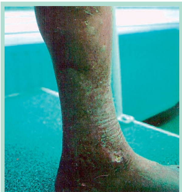
FIGURE 2 : Troubles trophiques graves avec persistance de perforantes jambières incontinentes.