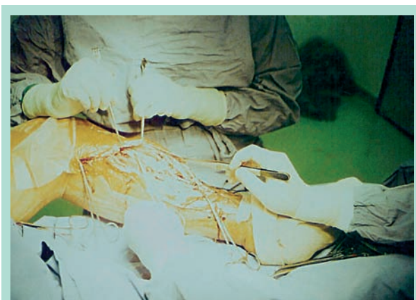
FIGURE 3 : Intervention de Linton pour ligaturer des perforantes pratiquées il y a 20 ans.

Une revue de la littérature récente réalisée par Howard [10] montre qu'il n'y a pas de bénéfice notable entre l'éveinage seul et l'éveinage associé à la chirurgie des perforantes en terme de cicatrisation de l'ulcère à 60 jours.