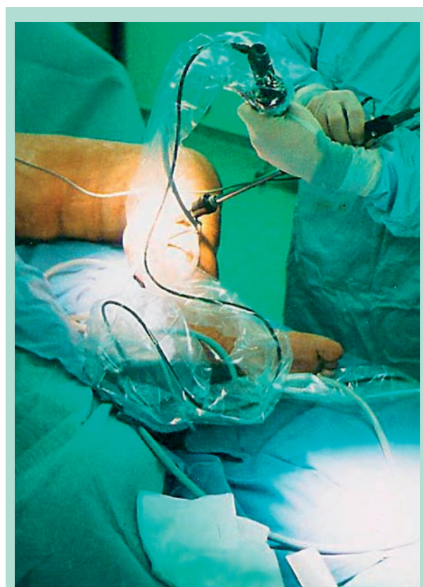
FIGURE 7 : Vue opératoire.