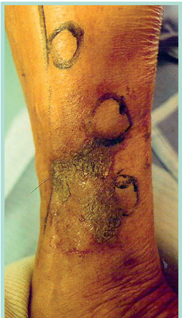
FIGURE 5 : Récidive des troubles trophiques et des perforantes pathologiques.