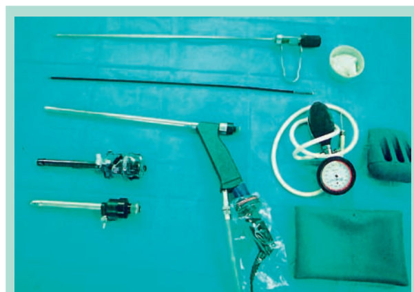
FIGURE 6 : Matériel chirurgical pour ligature endoscopique des perforantes.

92 perforantes ont été ligaturées associées à 25 éveinages partiels et 22 phlébectomies. Une contention de classe 2 a été installée par bas et une thromboprophylaxie sous-cutanée pendant 10 à 15 jours a été prescrite ainsi que des antalgiques mineurs de type paracétamol. Les patients quittaient l'établissement le lendemain de l'intervention.