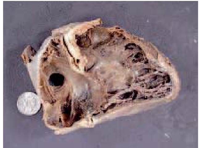
Fig. 2. – Pièce de dissection

La taille de cette communication, mesurée sur des études autopsiques (Fig. 2), varie de 1 à 10 mm de long, voire 19 mm [35, 65] (pour une moyenne à 5) et de 2 à 15 mm 2 (moyenne 4,5) [1]. Celle-ci augmente avec l'âge [7], de 3,4 à 5,8 millimètres (de la première à la dixième décennie de la vie [35]).