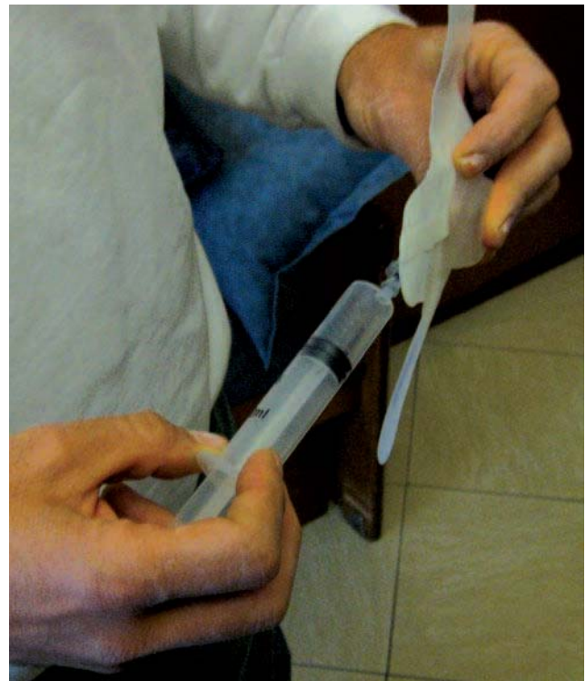
Fig. 1. – La vésicule gonflable fait partie d'un pansement - sparadrap (Safeguard TM®)