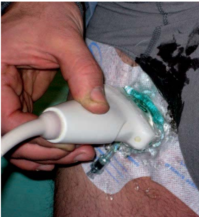
Fig. 2. – Application du Safeguard TM® au niveau de la terminaison de la GVS et gonflage de la vésicule sous écho-guidage