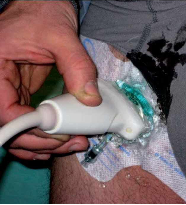
Fig. 2. – Application du Safeguard TM® au niveau de la terminaison de la GVS et gonflage de la vésicule sous écho-guidage