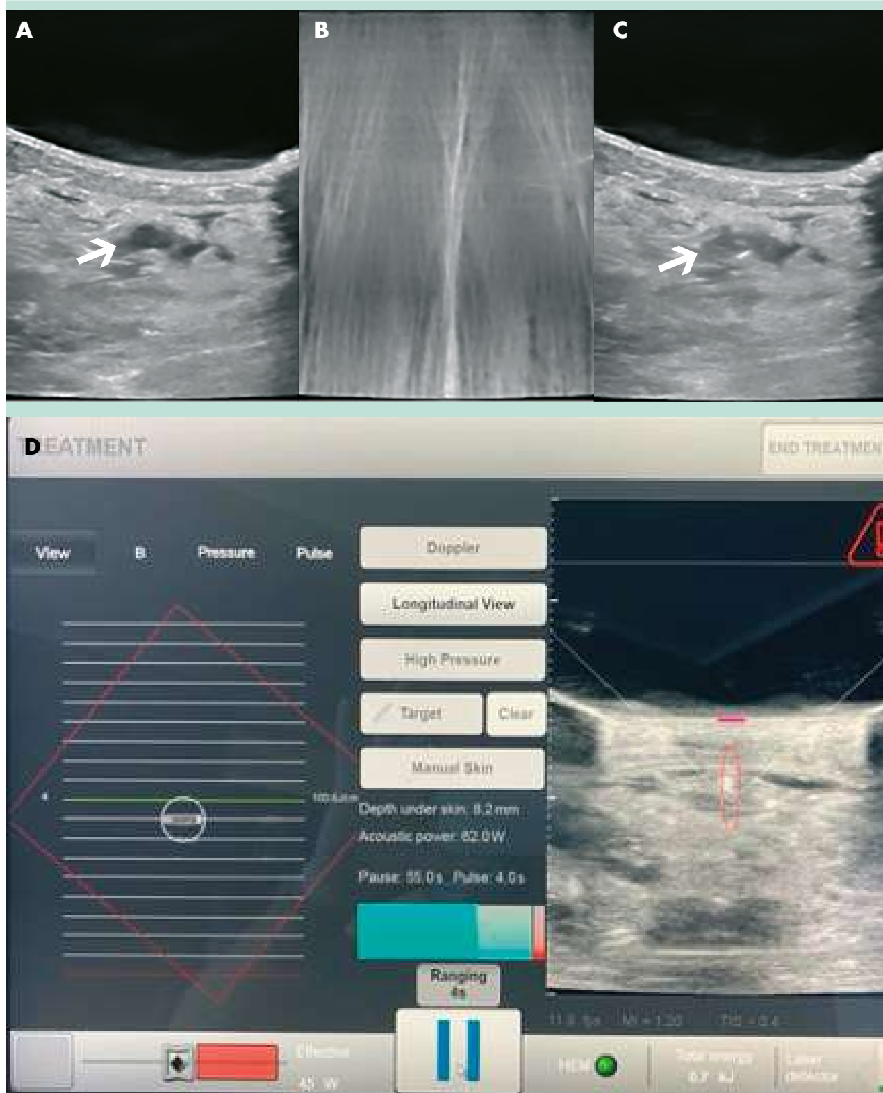
FIGURE 2: Procédure HIFU.

Images échographiques (A) Veine grande saphène avant procédure (B) Per procédure (C) Obturation de la veine grande saphène post procédure, (D) Moniteur de travail tactile.