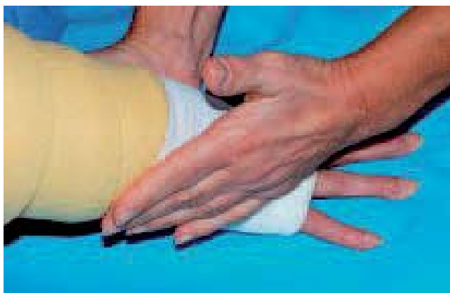
Fig. 3. – Bandage peu élastique avec bandes à allongement court (Somos®) sur un capitonnage de mousse NN®

Les bandages représentent l'élément essentiel et fondamental de la physiothérapie décongestive complète, destiné à réduire le volume du lymphœdème de 25 à 73 % selon les études en 1 à 4 semaines [3-7]. Il s'agit de poser, sans serrer, des bandes peu élastiques – c'est-à-dire à allongement court < 100 % [8] – sur un capitonnage fait, soit de coton, soit de mousse ou des deux. L'étape suivante est la pose de bandes peu élas-