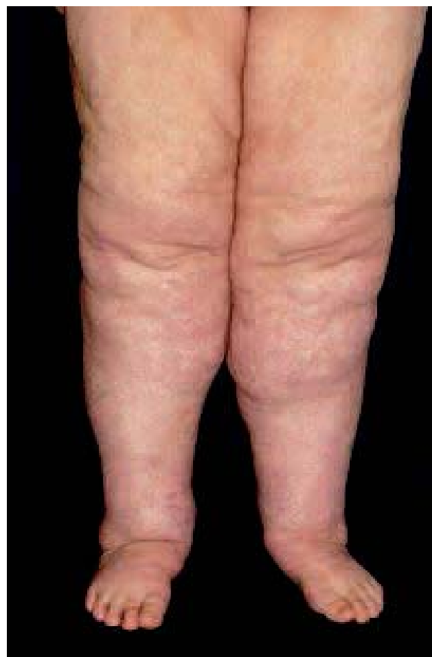
Fig. 4. – Lipœdème

Le diagnostic de lipœdème est clinique. De nombreux signes cliniques le distinguent du lymphœdème. Wold et coll. ont proposé en 1949 des critères diagnostiques qui sont résumés dans le tableau II [27]. Le lipœdème touche quasi exclusivement les femmes (1 homme sur 119 cas dans la série de Wold) obèses (85 %) et débute à partir de la puberté mais la survenue plus tardive n'exclut pas le diagnostic [27, 28]. L'augmentation du tissu adipeux est avant tout proximale, allant du bassin aux chevilles ; elle est généralement symétrique avec un respect initial du pied, alors que la partie supérieure du corps est épargnée (Fig. 4). Le pincement de la peau, qui reste souple, est douloureux (« cellulalgies »). Il n'y a pas d'œdème après une période de décubitus mais ils peuvent apparaître, en restant modérés, après orthostatisme. On peut aussi