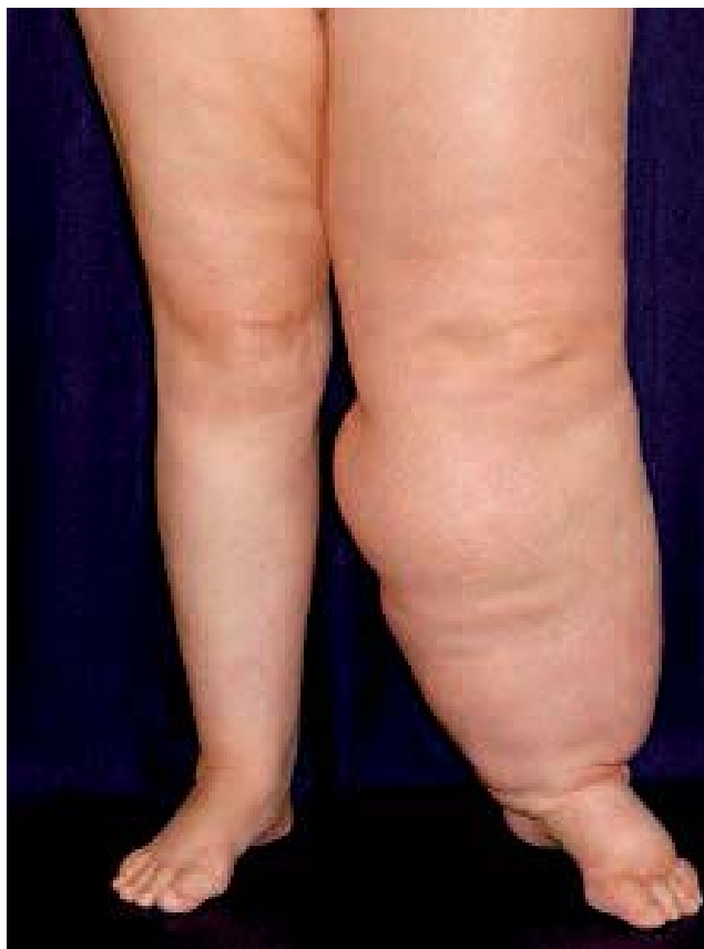
Fig. 1. – Lymphœdème primitif du membre inférieur gauche

Les lymphœdèmes débutent en distalité, sur la face dorsale du pied, peuvent rester localisés ou avoir une extension ascendante en touchant la cheville, le mollet, le genou et la cuisse. Ils sont soit unilatéraux touchant alors tout le membre, soit bilatéraux, le lymphœdème restant alors plutôt localisé en sous-gonal (Fig. 1). Beaucoup plus rarement, on peut voir des formes suspendues touchant exclusivement la cuisse. L'impression de lourdeurs est le symptôme le plus fréquent, décrit parfois comme une sensation de pesanteur du membre atteint par le lymphœdème. La douleur est beaucoup plus rare et doit faire évoquer une pathologie associée (thrombose veineuse profonde, sciatique, neuropathie pour le membre inférieur). La peau du lymphœdème est d'aspect normal; elle est le plus souvent tendue (non plissable) et prend plus ou moins le godet. Les plis de flexion des orteils sont accentués et il existe un œdème élastique du dos du pied avec épaissement de la peau. Le signe de Stemmer, presque pathognomonique, est défini par l'impossibilité de plisser la