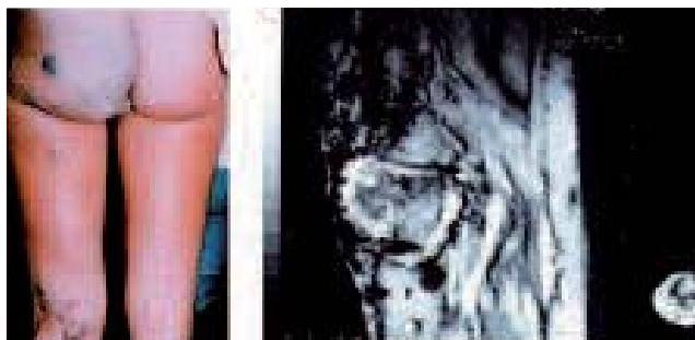
Fig. 4. – Malformation géante glutéo-vulvaire et malformation de genou

Les malformations veineuses ou à bas débit sont les plus fréquentes. Elles sont fréquemment d'une morphologie complexe et d'une difficulté thérapeutique proportionnelle à leur localisation et à leur taille (Fig. 4). Topographiquement, elles ne présentent aucune prédilection ; leur localisation anatomique complexe et variable limite les possibilités d'une exérèse complète. La chirurgie n'est pas possible dans les malformations de grande taille ou avec infiltration des masses musculaires.