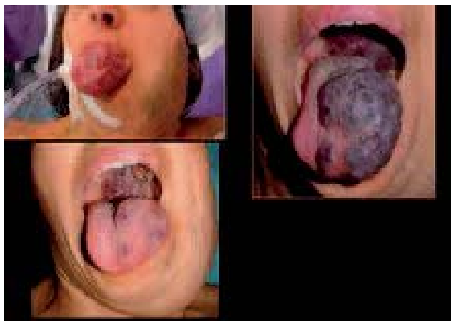
Fig. 9. - Malformation touchant la langue, le visage et le pharynx. Évolution excellente après 7 séances de traitement