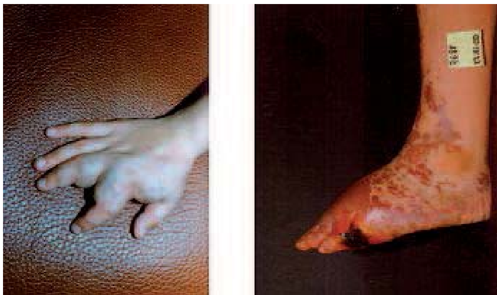
Fig. 3. – Malformations avec nombreuses communications artério-veineuses