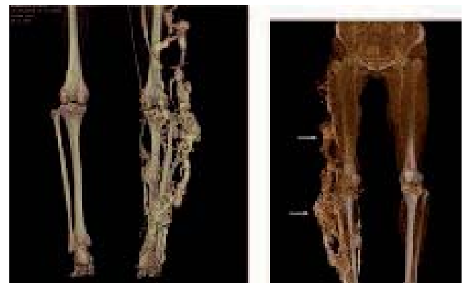
Fig. 6. – L'évaluation préalable du réseau veineux profond est indispensable avant traitement des patients porteurs d'un syndrome de Klippel-Trenaunay

Dans un autre cas, chez une jeune fille présentant une malformation intramusculaire de l'avant-bras, nous avons injecté du Polidocanol 4 % dans l'artère cubitale. Immédiatement sont apparues douleur et impuissance fonctionnelle des 4 ème et 5 ème doigts et la présence de petites aires violacées irrégulières en relation