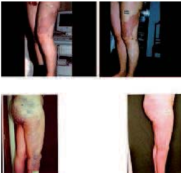
Fig. 5. – Ces deux patients présentaient douleur et impotence fonctionnelle au niveau du genou qui ont disparu dès le 1 er traitement. L'élimination des veines pathologiques superficielles est évidente

Avec le système de traitement tous les 10-15 jours, la réduction de l'importance des malformations est rapide, nous permettant d'obtenir des avancées considérables.