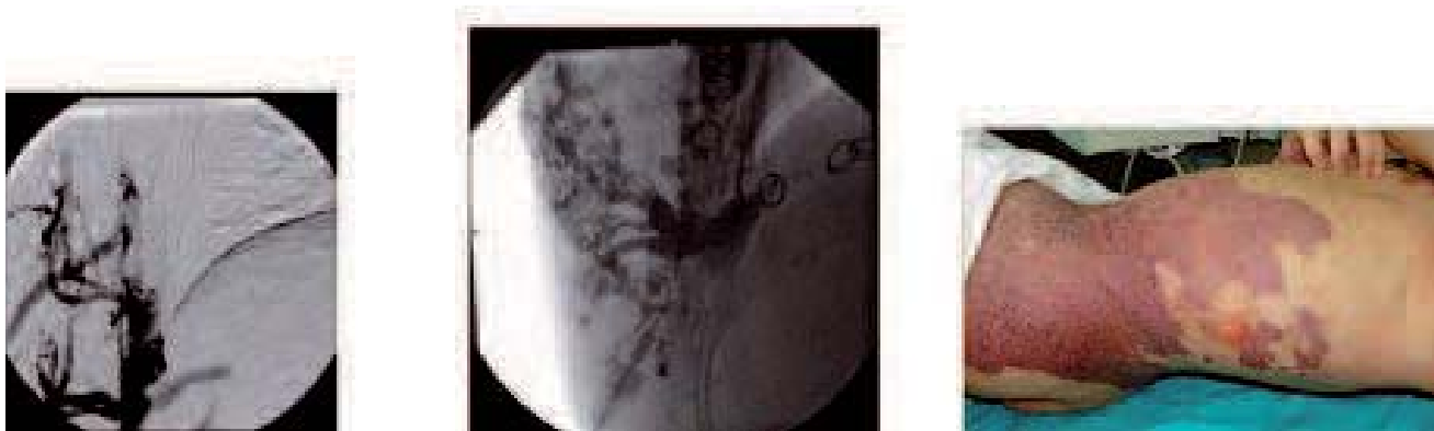
Fig. 8. - L'occlusion endovasculaire de ces veines par des coils a permis d'injecter de la micro-mousse dans le réseau veineux sous-cutané avec d'excellents résultats