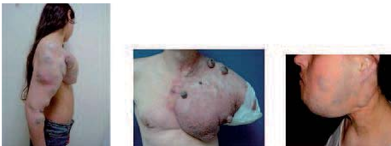
Fig. 1. – Malformations inopérables

Les malformations inopérables de haut débit sont traitées par embolisation des pédicules artériels nourriciers.