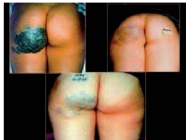
Fig. 10. - Cette énorme lésion de la fesse chez une jeune fille a diminué considérablement après 20 sessions. La stabilité des résultats à cinq ans est évidente sur la photo