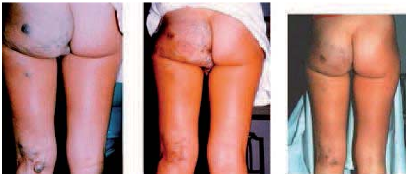
Fig. 11. – Chez cette jeune femme de 22 ans, la réduction de la malformation vulvo-fessière et la disparition de la dilatation du creux poplité lui ont permis de reprendre ses activités quotidiennes