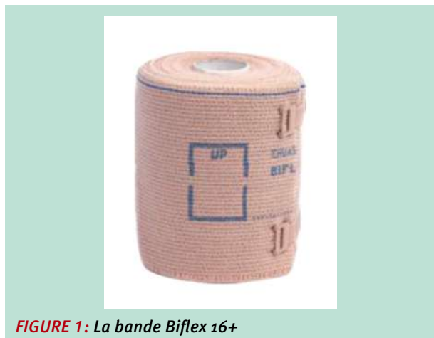
FIGURE 1: La bande Biflex 16+

Le lymphœdème concerne le membre supérieur mais peut également affecter le sein et le thorax. Au niveau du membre supérieur, il peut engendrer des symptômes associés telles que la douleur, la lourdeur, l'oppression et la réduction de l'amplitude de l'épaule ayant un effet négatif sur la vie quotidienne des patientes ainsi que sur leur activité globale [1].