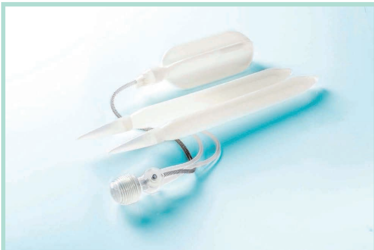
FIGURE 1 : L'implant pénien est composé d'un réservoir, de 2 cylindres et d'une pompe de gonflage.