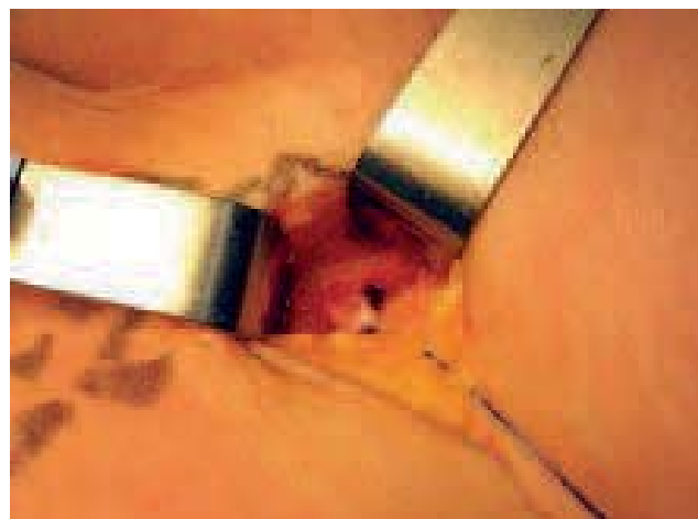
Photo 2. – Double ligature de prolène sur le moignon résiduel au ras de la veine fémorale

Aujourd'hui, depuis 2000, nous avons réduit encore la dissection en mettant simplement en place une double ligature de prolène au ras de la veine fémorale (Photo 2). Cela nous permet d'injecter de façon sécurisée de la mousse dans la néovascularisation (NV), directement ou par l'intermédiaire d'un tronc résiduel, afin de fermer toutes les communications veineuses situées distalement par rapport à la ligature de prolène faite au ras de la veine fémorale. L'injection par l'incision de reprise de crossectomie est faite par une aiguille 25 Gauge à l'extrémité d'un prolongateur afin d'éviter tout déplacement de l'extrémité de l'aiguille pendant l'injection (Photo 3). Cette mini-dissection sans bistouri électrique, sans drainage post-opératoire, a pour but de diminuer le traumatisme, source d'hématomes et de phénomènes inflammatoires. Certaines études ont montré que la nouvelle NV était plus importante dans la chirurgie de la récurrence (plus traumatique) que dans la chirurgie des varices, lorsque l'intervention était faite de façon traditionnelle, c'est-à-dire avec une large dissection de la région fémorale [2].