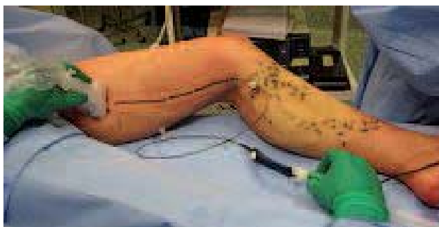
Photo 5. – Sclérose de la NV : Le cathéter d'introduction de la fibre laser ou le canal opérateur du cathéter ClosureFast® permet d'injecter de la mousse dans la NV

2 mm [11]. L'étude de la récurrence variqueuse poplitée après chirurgie de la petite saphène a montré que 75 % des cas étaient des insuffisances d'exérèses (fautes techniques), soit par la persistance complète d'une petite saphène, soit par la persistance d'un moignon long résiduel [12]. Des études anciennes [13, 14] et plus récentes [15] ont même montré que les ligatures à distance de la petite saphène sus-fasciale entraînaient de 13 à 50 % de récurrence à 5 ans et même à 3 mois. La chirurgie à ciel ouvert de la récurrence petite saphène garde donc une place très importante dans le traitement de la récurrence petite saphène. Cette réintervention est en général assez souvent possible parce que le précédent opérateur qui a, par définition, laissé un moignon trop long, a laissé aussi une zone cicatricielle localisée à distance de la JSP. La réintervention est donc assez souvent située au-dessus, en zone saine, à distance des zones précédemment opérées.