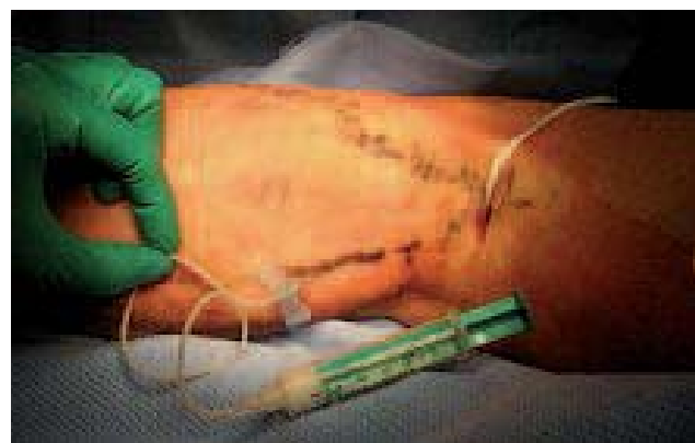
Photo 7. – La sclérose per-opératoire à la mousse des recanalisation d'hématomes est la seule technique utilisable

1) Les 110 membres ont eu des phlébectomies extensives. Sur le territoire de la GVS, 29 membres ne présentaient que des varices isolées. Parmi eux, 11 ont eu, en plus, une injection de mousse sclérosante pour scléroser soit une petite perforante de cuisse, des veines périméales, de la NV ou des veines lymphoganglionnaires.