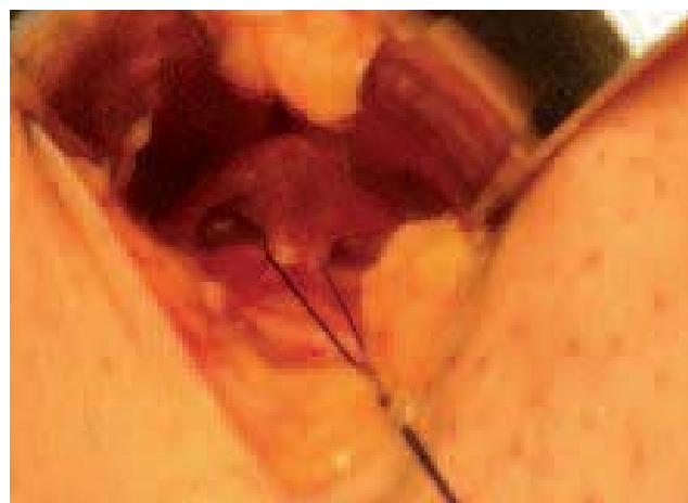
Photo 1. – Voie d'abord latérale en dehors de la zone cicatricielle et de la lame lympho-ganglionnaire

De cette façon, par une voie d'abord très petite et très oblique, on peut accéder à la veine fémorale et la suivre jusqu'à la base de l'ancienne JSF. Pendant de nombreuses années, nous avons lié et sectionné entre