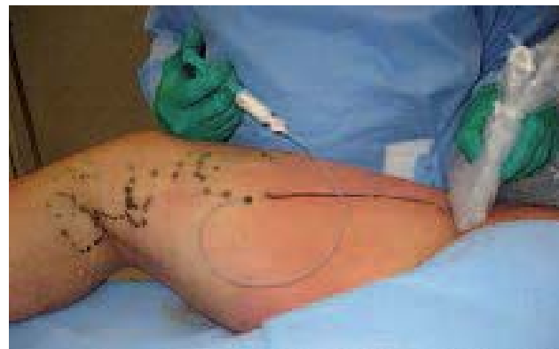
Photo 4. – Sclérose de la NV : Injection faite de bas en haut à l'aide d'un cathéter introduit dans un tronc résiduel, souvent une saphène antérieure accessoire résiduelle

plus superficiels et petits sont traités par ClosurePlus® ou ClosureFast® pour les grandes longueurs ou sclérose mousse sur cathéter pour les petites longueurs. Le cathéter d'introduction de la fibre laser ou le canal opérateur du cathéter ClosurePlus® ou ClosureFast® permet d'injecter de la mousse dans la NV (Photo 5).