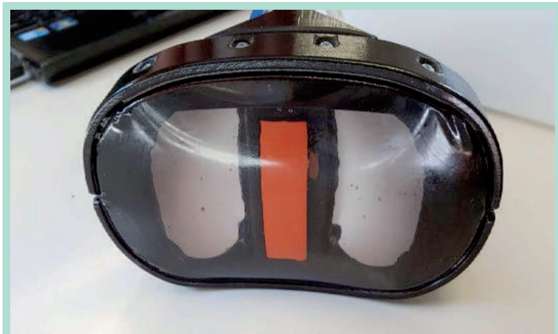
FIGURE 2 : Prototype de sonde « Veinsound ».