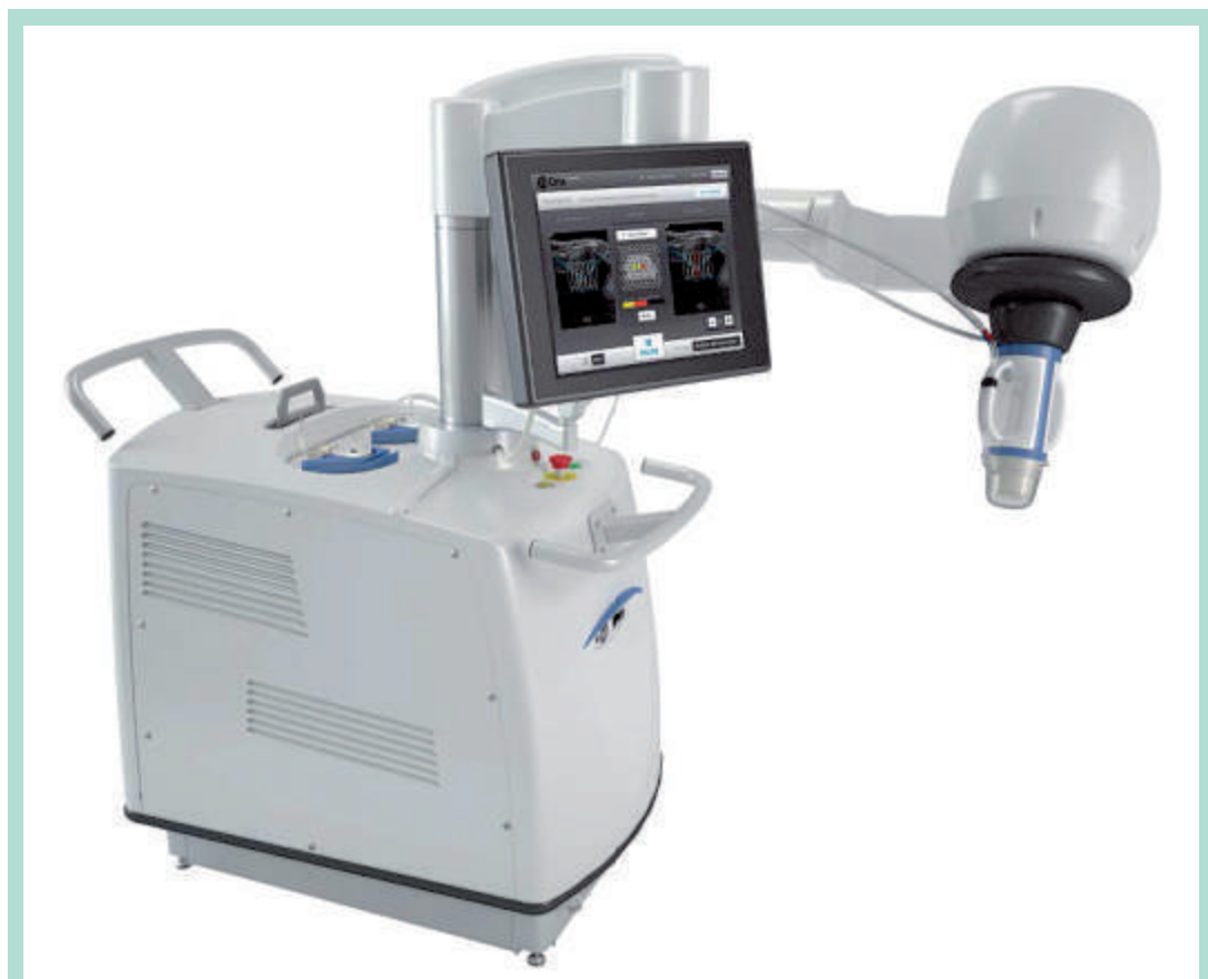
FIGURE 3 : L'appareil « Sonovein » de Theraclion.