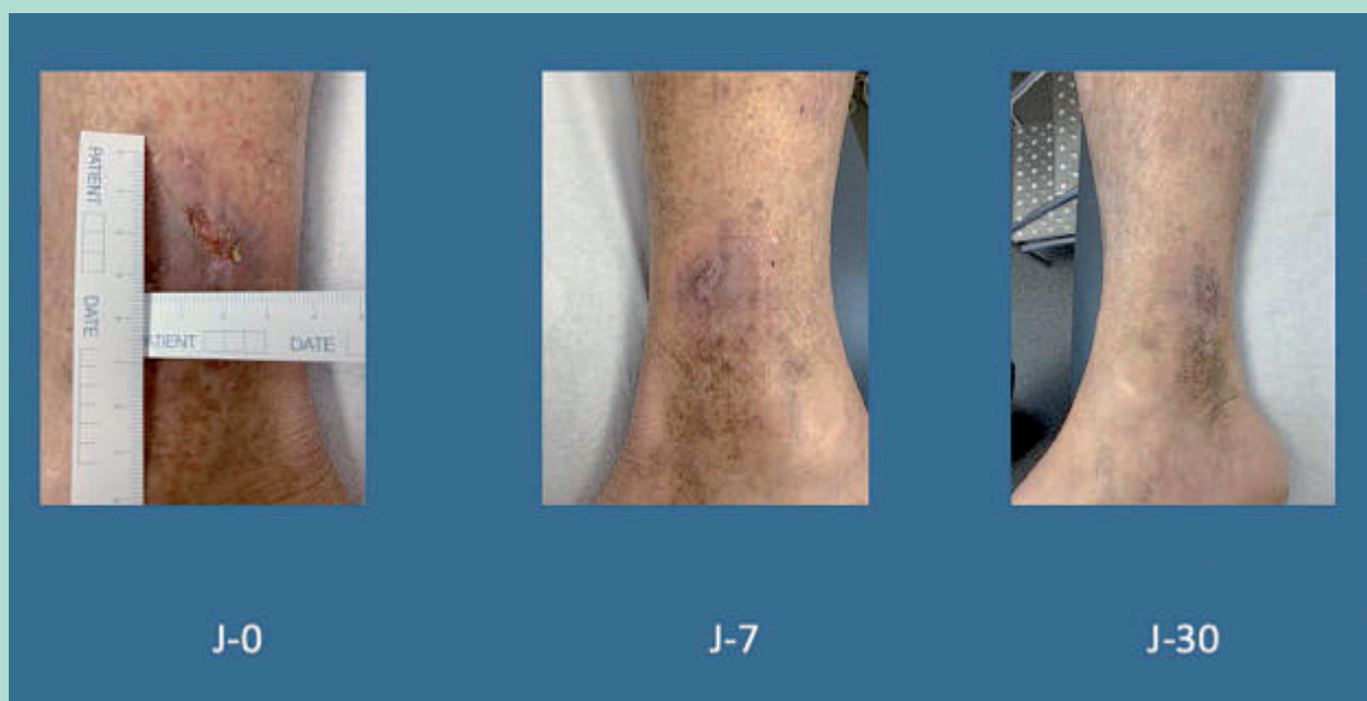
FIGURE 3 : Cicatrisation ulcère variqueux à J-30 post traitement grande veine saphène et perforantes par colle cyanoacrylate.