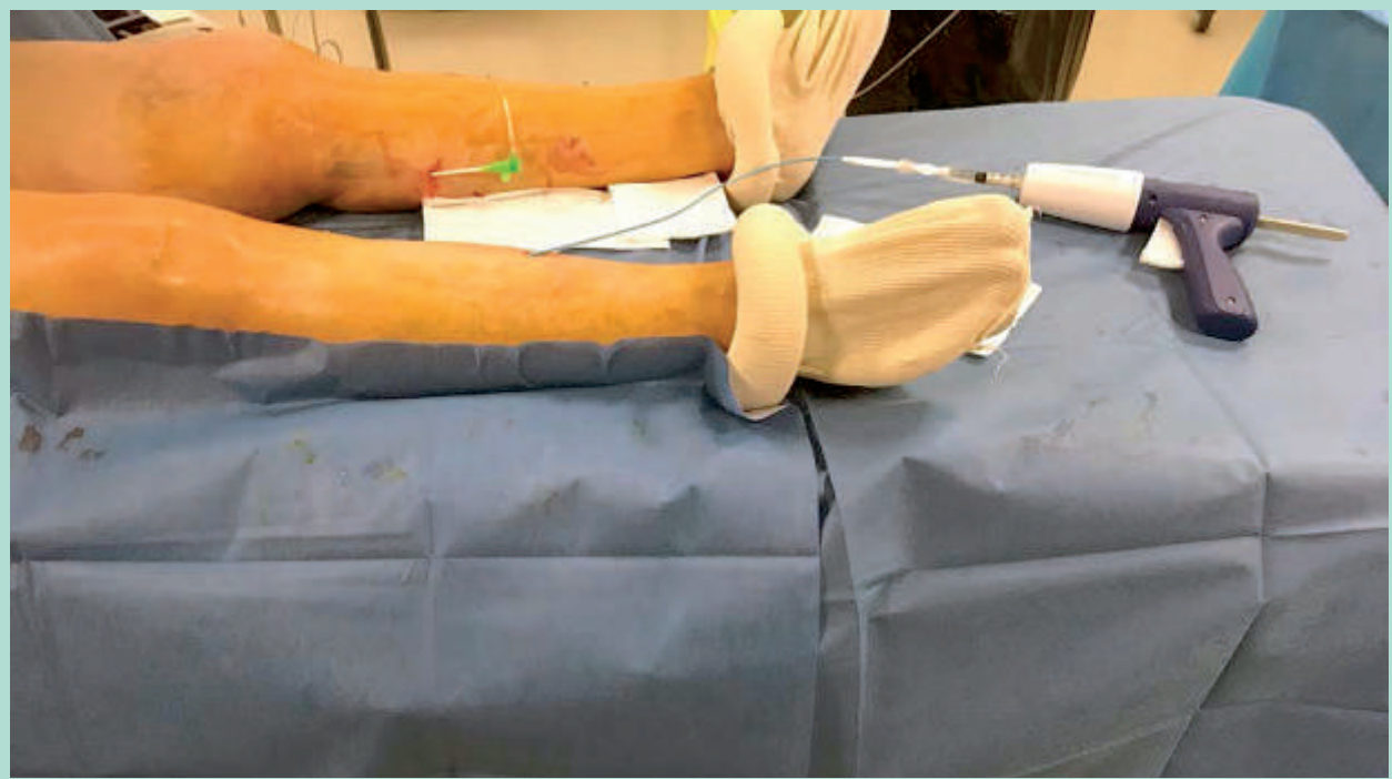
FIGURE 1 : Système de traitement des grandes veines saphènes par colle Venaseal®.

Par une pression régulière sur la gâchette du pistolet, le dispositif est activé jusqu'à l'apparition d'une première goutte de colle.