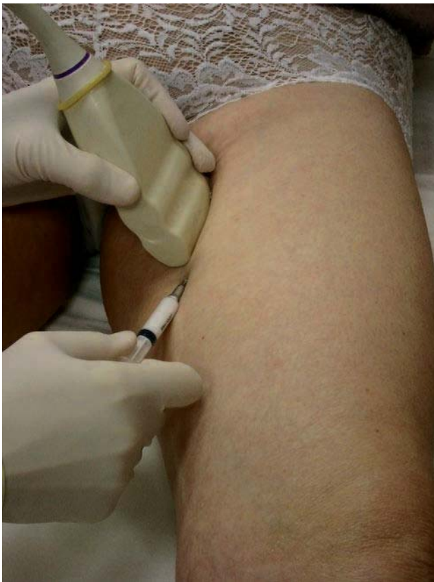
Fig. 2. – Injection écho-guidée à l'union tiers supérieur – tiers moyen de cuisse de la grande veine saphène par ponction directe écho-guidée

– L'accès ouvert consiste à mettre en place un abord veineux fixe (Fig. 3), comme pour une perfusion, ce qui peut se faire, selon la profondeur de la veine et selon la procédure, grâce à un perfuseur épicroânien (Butterfly®), une aiguille montée sur un connecteur fin, un microcathéter, voire un cathéter long (technique de Seldinger par exemple). Le matériel est ensuite fixé à la peau par un ruban adhésif.