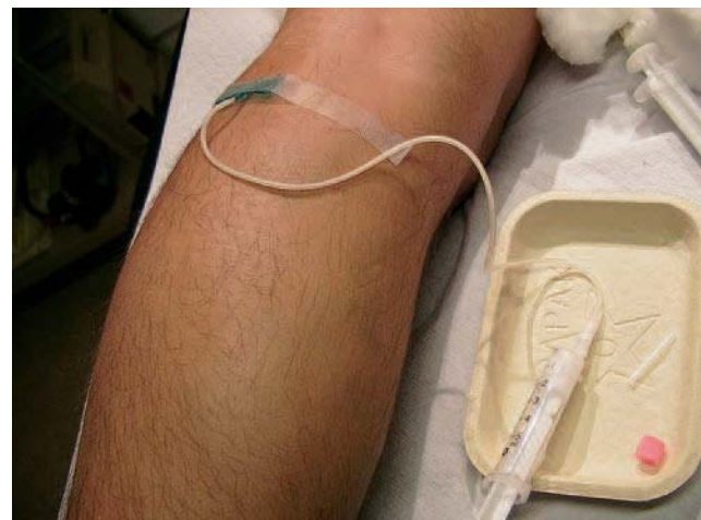
Fig. 3. – Un perfuseur épicroânien a été mis en place sous contrôle échographique dans une perforante de la fosse poplitée. L'aiguille a été introduite biseau vers le bas et les ailettes sont fixées à la peau par un adhésif

Des cathéters longs de divers types ont été proposés : avec ou sans ballonnets, avec ou sans perforations latérales... A ce jour ils n'ont pas apporté de résultats supérieurs aux autres types d'injection.