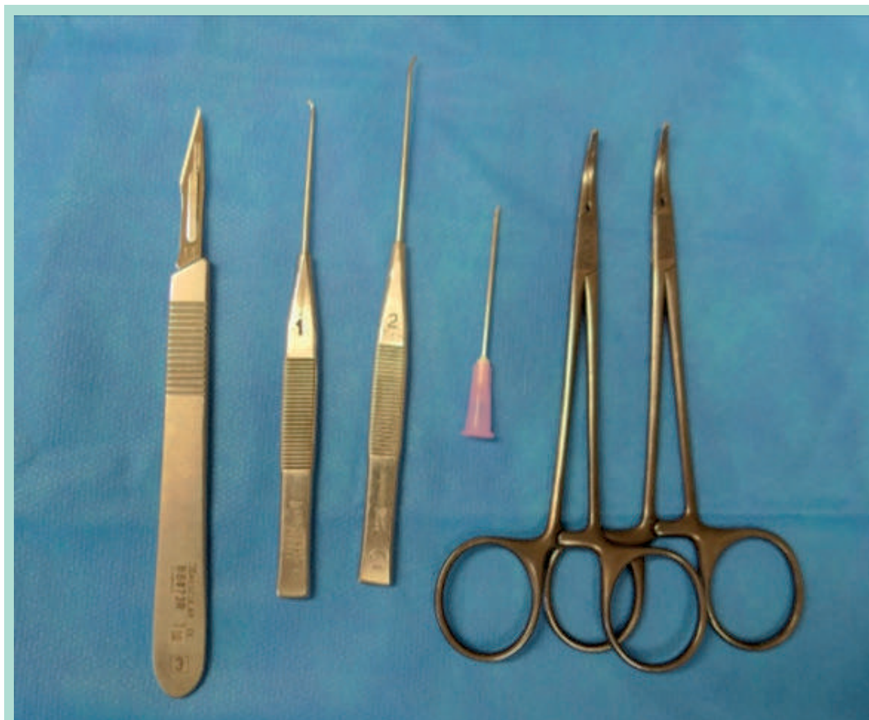
FIGURE 2 : Instruments nécessaires à une intervention de varices en 2021.