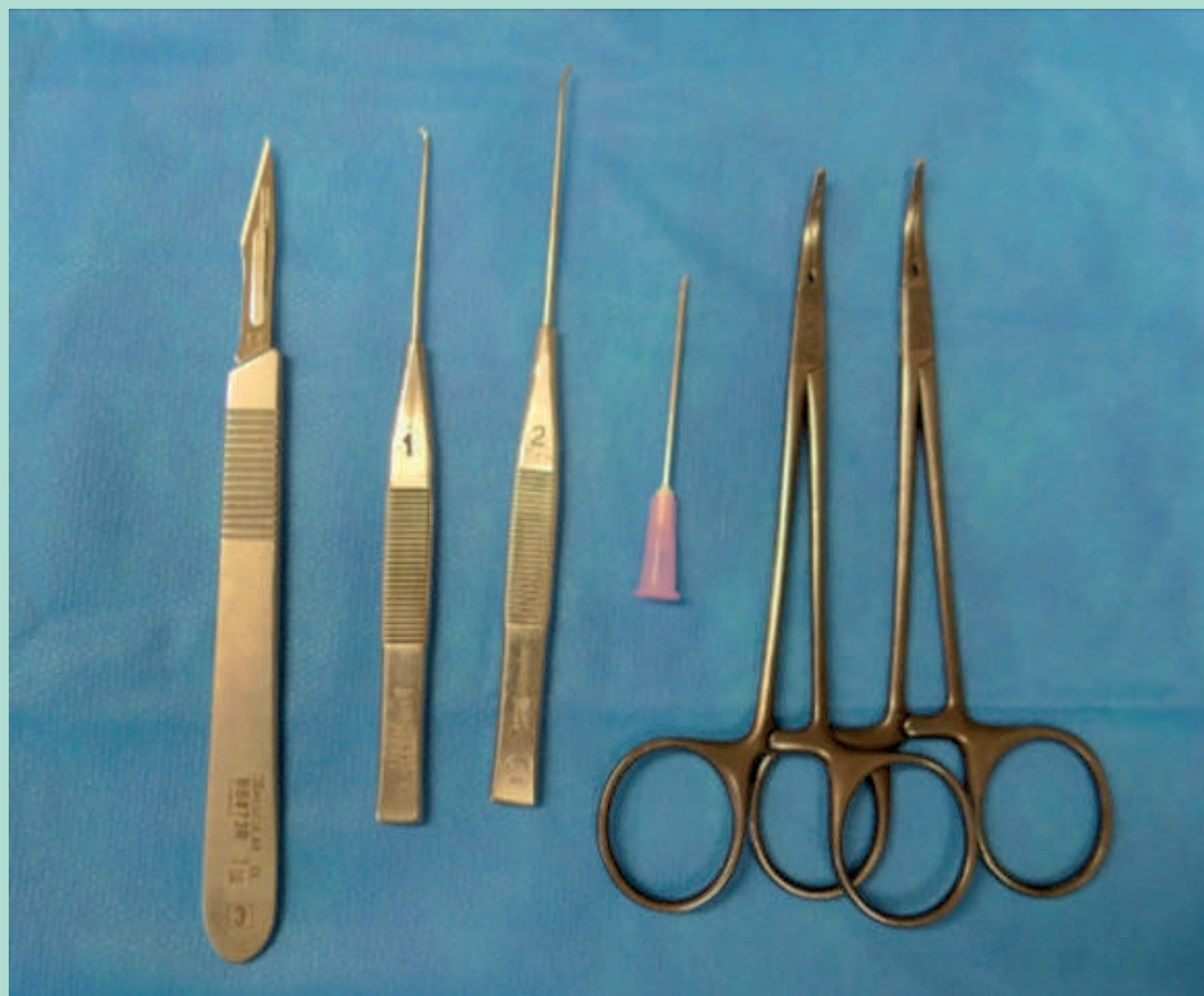
FIGURE 2 : Instruments nécessaires à une intervention de varices en 2021.